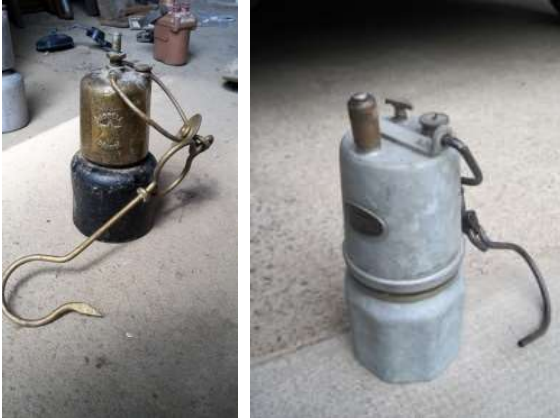
Lampe de mineur acétylène carbure (1951/1958).