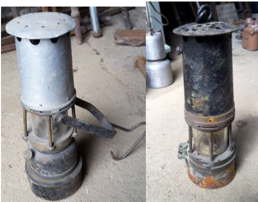
Lampes de mineur à essence benzine . (1916/1918)