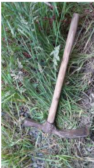
Herminette allemande (1942/1944) utilisée pour créer une saillie sur les bois où on déposait des poutres pour consolider le plafond de la galerie.