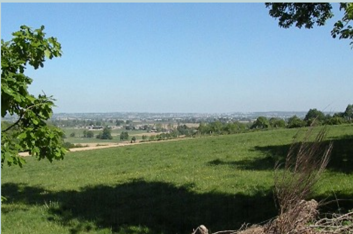
Ai piedi del castelletto, la scoperta di uno stupendo paesaggio con la città di Fougères ai nostri piedi.

E' anche un luogo ricco da un punto di vista storico.