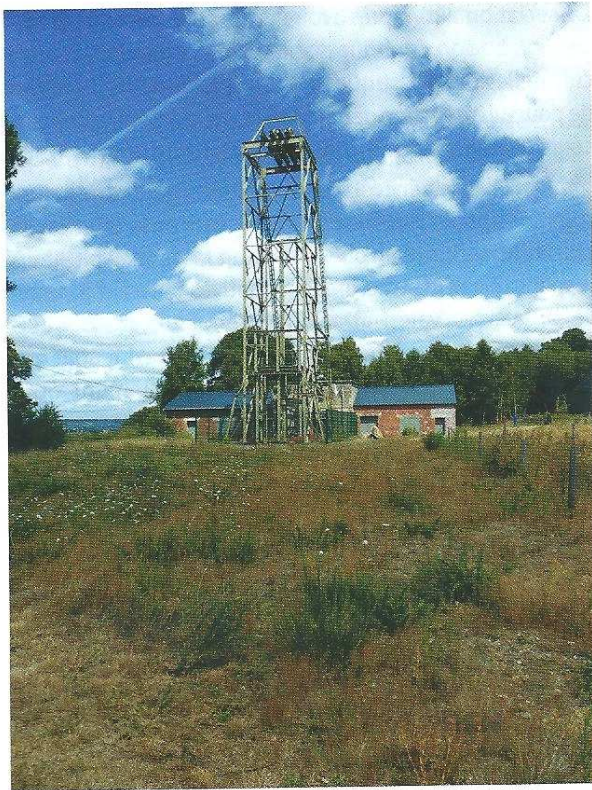
Photo 1. Le chevalement, témoignage de l'exploitation minière de Montbelleux.

des moulins en Bretagne. Une exposition de documents anciens, d'archives aimablement confiées par le propriétaire, des démonstrations de forgerons ont permis d'attirer environ 600 visiteurs. Ce succès nous a confirmé dans notre démarche : il fallait faire revivre le souvenir de ce site minier, dernier vestige du passé minier breton dans le secteur.