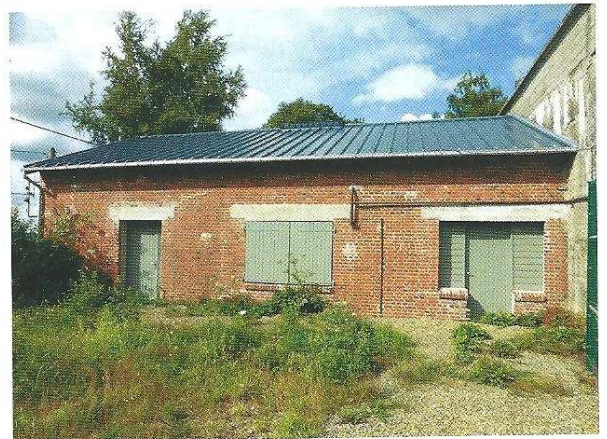
Photo 2. Le bâtiment de la forge au pied du chevalement de Montbelleux.

Une association locale travaillant sur la mémoire orale nous accompagne depuis le début pour collecter les